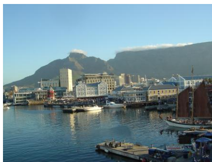
Blick von der Victoria u. Alfred Waterfront

In zahlreichen Lokalen kann man auf der Terrasse sitzen und bei Wein oder Bier und einer Vielfalt internationaler Speisen über die City hinweg direkt auf die Steilwand des Tafelbergs schauen.