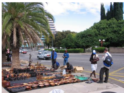
Straßenhandel in Windhoek

Im Rahmen der Stadtrundfahrt fahren wir zunächst nach Katutura, dem Wohngebiet der schwarzen