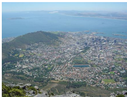
Blick vom Tafelberg auf Kapstadt

Flughafen aus unternehmen wir eine Stadtrundfahrt durch Kapstadt - eine der schönsten Städte der Welt! Eine Auffahrt mit der Drahtseilbahn auf den Tafelberg (wetterabhängig) darf natürlich nicht fehlen.